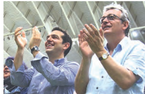
Pierre Laurent, secrétaire national du PCF, dirige le Parti de la Gauche Européenne avec Alexis Tsipras, le nouveau premier ministre grec.

En portant nos amis de Syriza au pouvoir, les grecs ont refusé clairement de voir leur avenir livré aux banques et au marché. Ils ont besoin de toute notre solidarité.